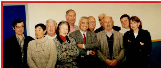
Conseil municipal 2002 - 2008