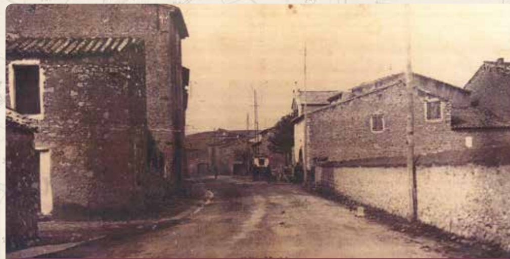
ENTRÉE EST EN 1910