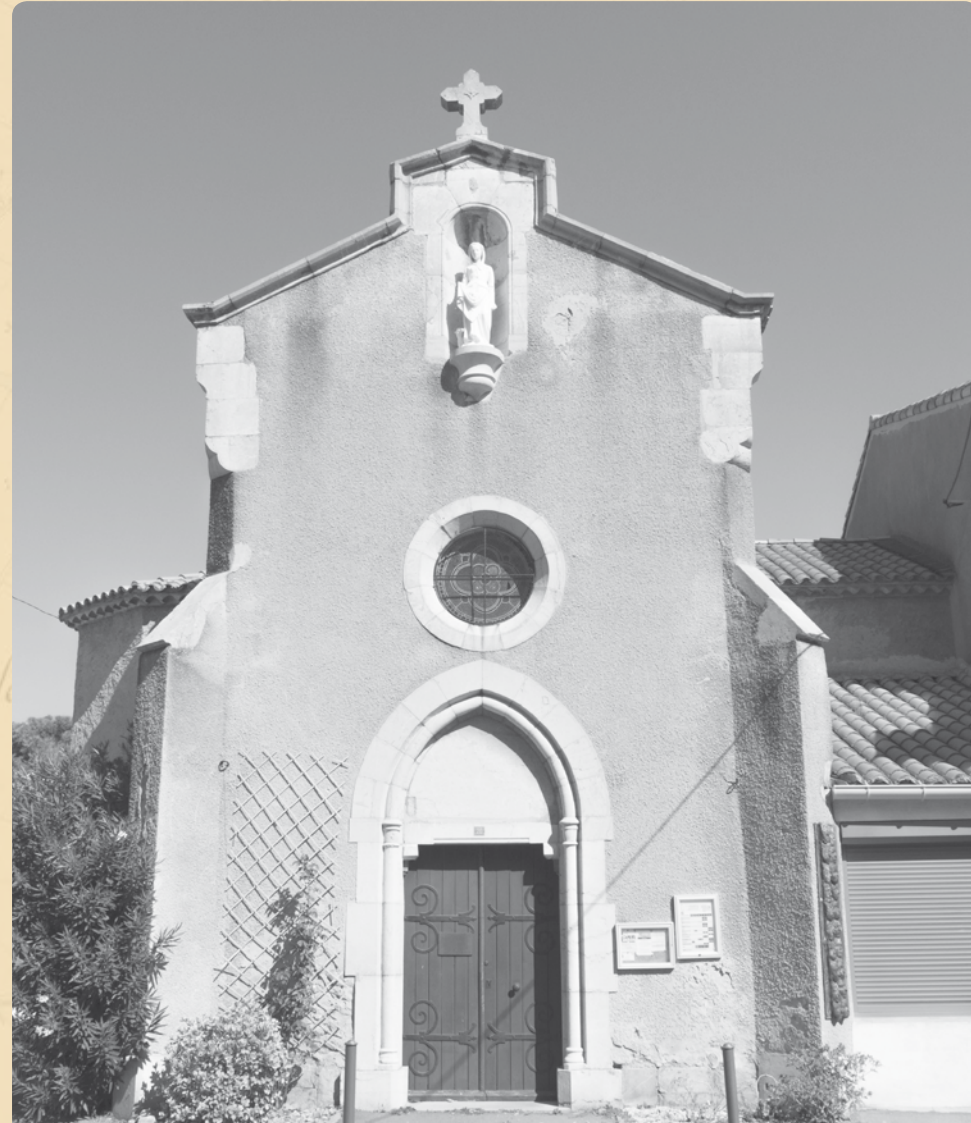
ÉGLISE SAINTE GERMAINE

152 ans après sa construction et 145 ans après sa consécration, cet édifice public, municipal depuis le 22 avril 1879 doit être réhabilité. La commune est accompagnée dans cet objectif par l'association de sauvegarde du patrimoine. Une "Association des Amis de Sainte Germaine" a été constituée à cet effet le 21 septembre 2019.