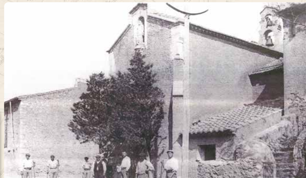
SAINTE GERMAINE EN 1903