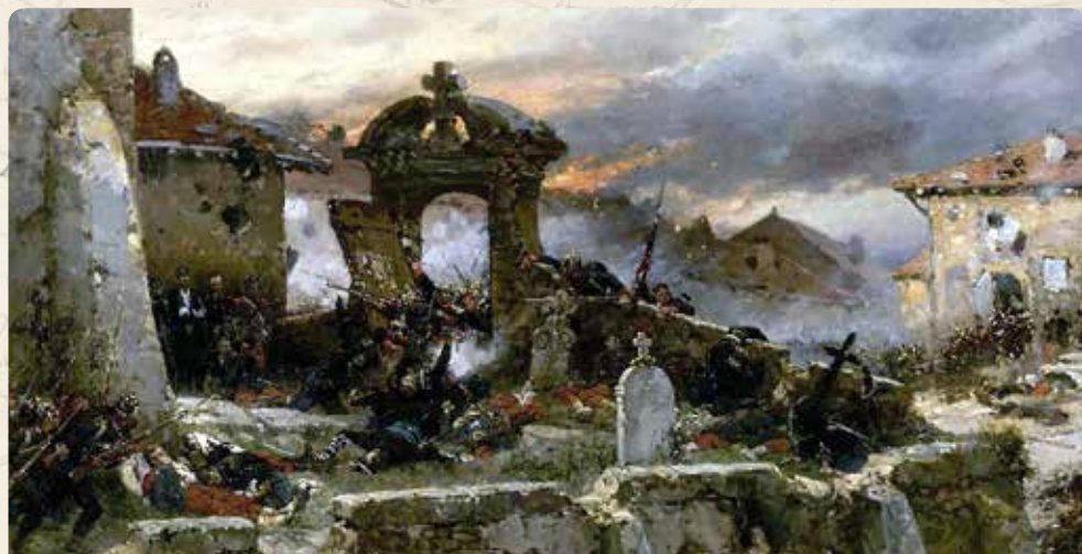
BATAILLE DE SAINT-PRIVAT (ALPHONSE DE NEUVILLE)

Au cours de cette période, la défaite de Sedan et la capitulation de Napoléon III provoquèrent, le 4 septembre 1870, la chute du Second Empire ainsi que l'exil de l'Empereur. En France, un régime républicain pérenne s'installe : la Troisième République. Le gouvernement provisoire décide de poursuivre la guerre sous l'impulsion de Gambetta. L'armée impériale est pratiquement décimée, mais la réserve constituée par les "Mobiles" est considérable. Le conflit fait 139 000 morts dans les rangs français (combat ou maladie) et 51 000 morts côté allemand.