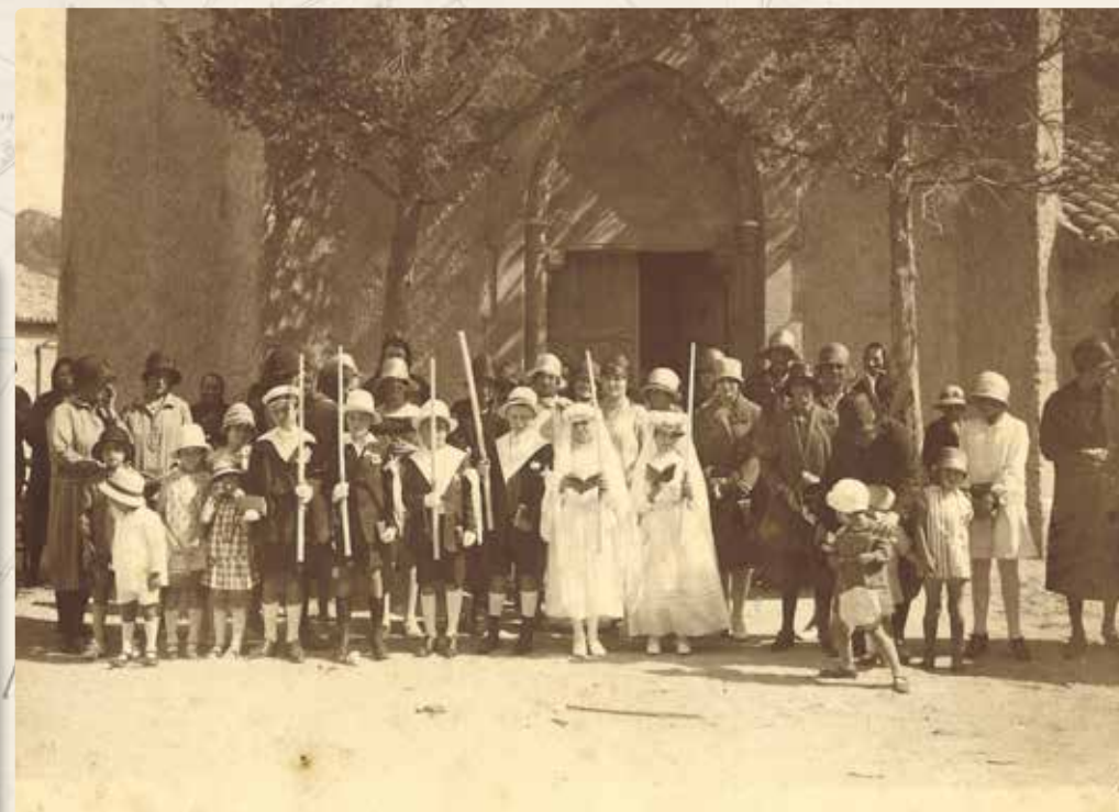
COMMUNION SOLENNELLE À SAINTE GERMAINE

Le 18 novembre 1898, le conseil municipal approuva une dépense de 50 francs pour réparation de la petite maison adjacente à l'église servant à loger "un pauvre de passage".