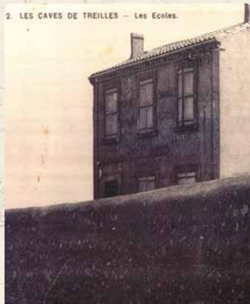
L'ÉCOLE EN 1888

Le plan cadastral de l'ancienne commune de Treilles datant de 1818 signalait quelques constructions éparpillées le long du chemin entre Treilles et Leucate.