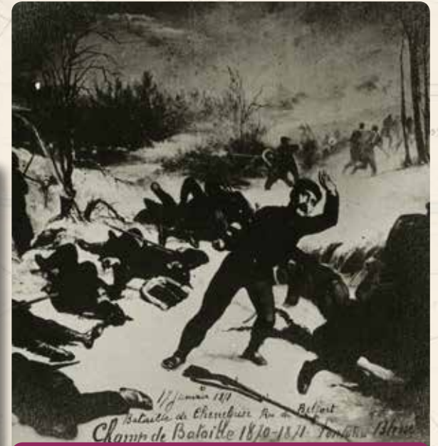
17 JANVIER 1871 - BATAILLE DE CHENEBIER ÉMILE FONTANEL Y EST BLESSÉ

Les 2 tableaux ci-dessous sont la propriété de la famille Fontanel et retracent la convalescence d'Émile.