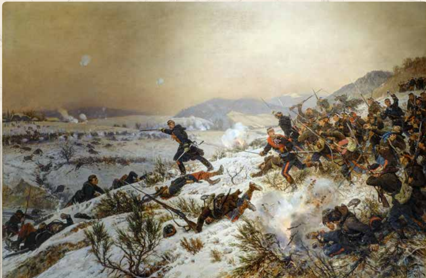
LE COMBAT DE CHENEBIER (ALPHONSE DE NEUVILLE)

Le 19 juillet 1870, l'Empire français déclarait la guerre au royaume de Prusse. Les hostilités allaient prendre fin le 28 janvier 1871 avec la signature d'un armistice. Le traité de paix, signé le 10 mai à Francfort-sur-le-Main, consacrait la défaite de la France avec comme conséquence territoriale : l'annexion par le Reich du territoire d'Alsace-Moselle.