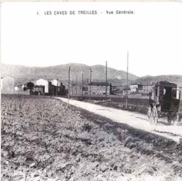
DÉVELOPPEMENT DE LA VIGNE DANS LA PLAINE