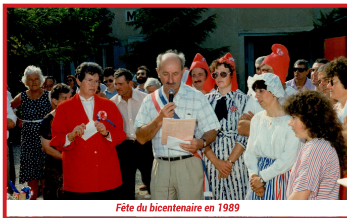
Fête du bicentenaire en 1989