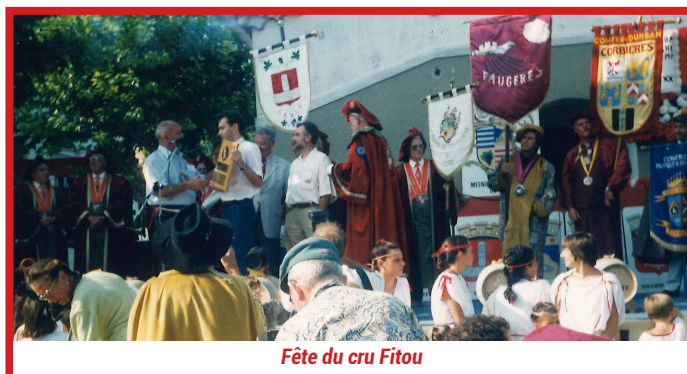
Fête du cru Fitou

Il était ami avec énormément de personnes ainsi qu'avec tous les maires des villages et les élus du département.