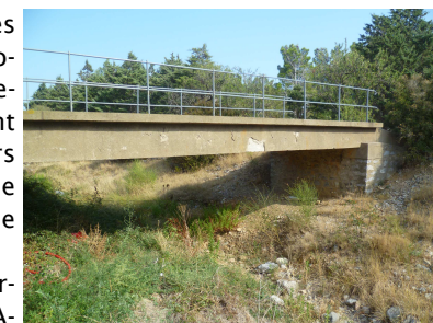
Vue du pont du cimetière sur le ruisseau de l'Aréna

En cas d'événements pluvieux intenses, le ruissellement est une problématique importante sur la commune de Caves. D'importants ruissellements peuvent être observés dans les rues du bourg et notamment à travers la rue de la Fontaine.